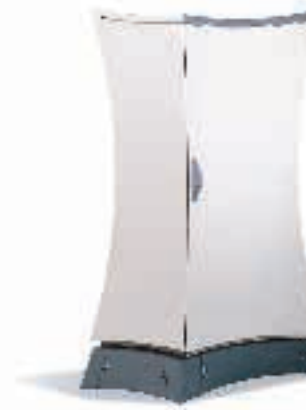
100% компактная технология