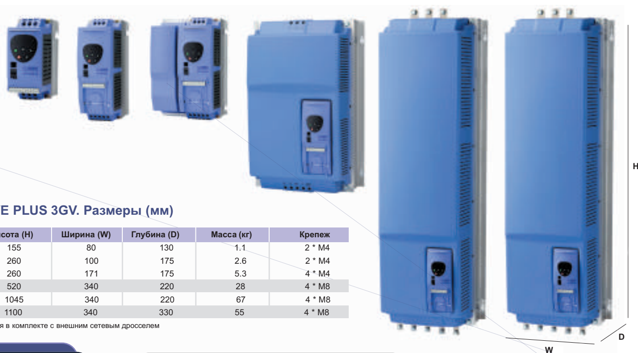
Габарит 1 Габарит 2 Габарит 3 Габарит 4 Габарит 5 Габарит 6